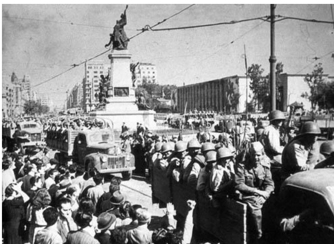
Советские войска в Кишиневе

В ходе Яско-Кишиневской операции были ликвидированы 18 немецких дивизий, 8 бригад штурмовых орудий, 11 артиллерийских полков, свыше 25 специальных частей. В 1944 году Советская Армия освободила территорию СССР. Но